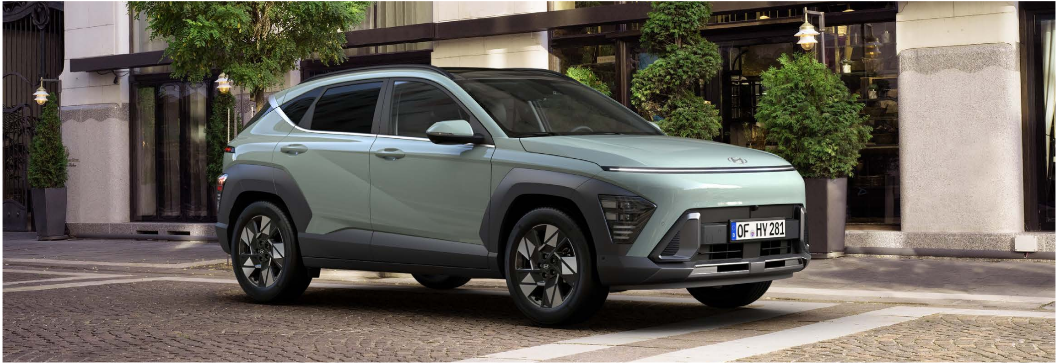
Hyundai KONA SX2 Hybrid MY26